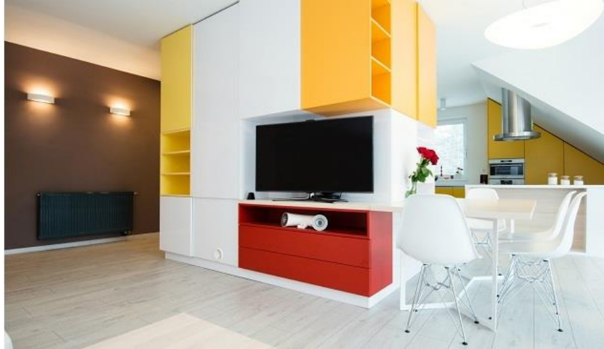
معماری داخلی آوانگارد - پالت رنگی خلاقانه و جسورانه

طراحی دکوراسیون داخلی به سبک آوانگارد نیز به دنبال شکستن چارچوب‌های معمول طراحی داخلی و نوآوری در فرم، رنگ، چیدمان و ... است. سبک دکوراسیون داخلی آوانگارد، ایده‌آل افرادی است که از چیزهای غیرمعمول لذت می‌برند و می‌خواهند فضایی مطابق با شخصیت خاص و خلاق خود طراحی کنند. شما می‌توانید با شکستن قواعد فرمی، رنگی، هندسی و به کار بردن مبلمان و نورپردازی غیرمعمول به فضایی آوانگارد برسید.