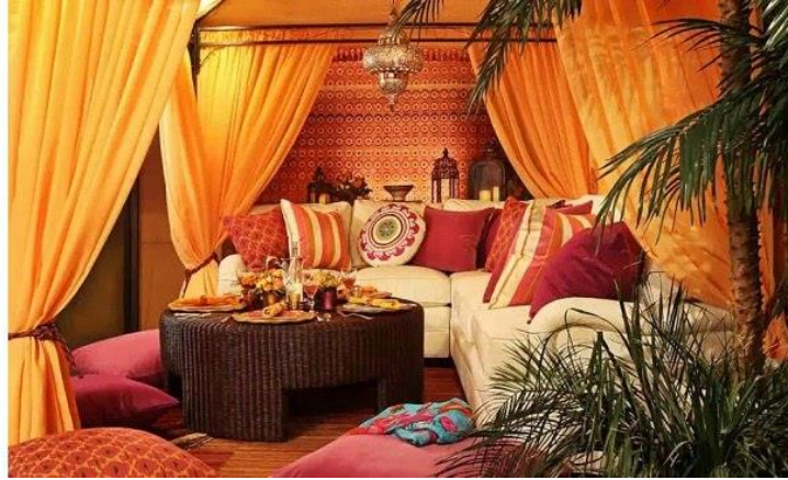
دکوراسیون داخلی به سبک عربی