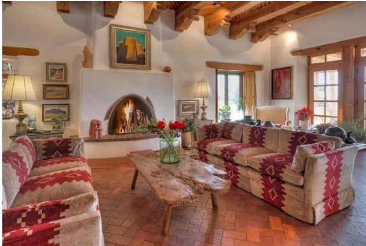
طراحی داخلی به سبک جنوب غربی آمریکا