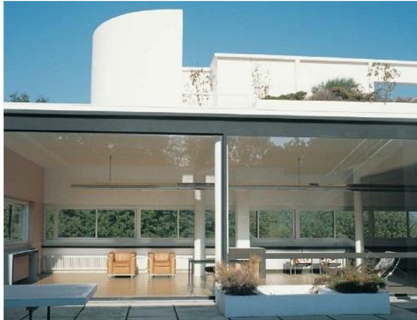
معماری داخلی ویلا ساوا اثر لکوروبوزیه

در سبک مدرن از احجام مکعبی با کم‌ترین تزئینات اضافی و غیرکاربردی استفاده می‌شود. هر چند فضای مدرن می‌تواند خشک و سرد به نظر برسد اما سادگی دکوراسیون داخلی مدرن تطابق فوق‌العاده‌ای با فضاهایی همچون ادارات، موزه و مراکز فرهنگی دارد.