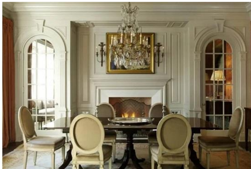
طراحی داخلی به سبک مستعمرات آمریکایی