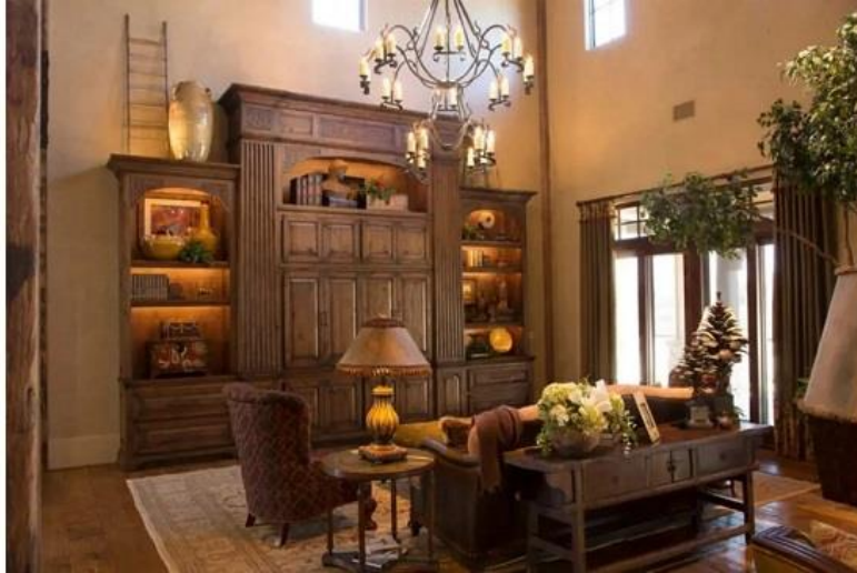
دکوراسیون داخلی به سبک توسکان ایتالیا