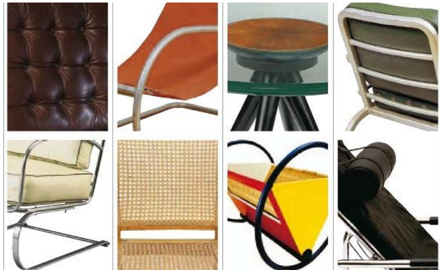
تعدادی از جزئیات مبلمان مدرن

سبک مدرن متعلق به اوایل قرن بیستم است. پیدایش سبک مدرن از مدرسه باوهاس آلمان شروع شد و در پی کنار گذاشتن تمامی شاخصه های ظاهری و تزئینی معماری کلاسیک بود. از مشخصات اصلی معماری داخلی مدرن می توان به مبلمان با سطوح صاف و براق و استفاده از مصالحی مانند چوب روکش دار، فلز لوله ای و شیشه اشاره کرد. در دکوراسیون داخلی مدرن از تم رنگی خنثی استفاده می شود و از رنگ های قوی تنها در نقاط تاکید مانند کوسن ها و لوازم تزئینی استفاده می شود.