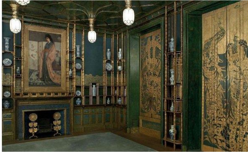
ترکیب عناصر سبک آرت نوو با معماری ژاپنی

برای بازسازی دقیق سبک آرت نوو در فضای خانه باید از کفپوش چوبی استفاده کنید و برای نورپردازی به سراغ لامپ‌های تزئینی آرت نوو مانند لامپ تیفانی بروید. بکارگیری سطوح شیشه‌ای رنگارنگ با نقوش ارگانیک همچون رویش ساقه گیاه در درها و کابینت‌ها، کمد لباس و آینه‌ها، حس هنری آرت نوو را در فضای داخلی ایجاد می‌کند.