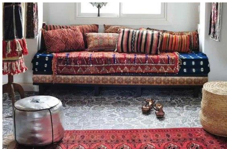
طراحی داخلی به سبک مراکشی