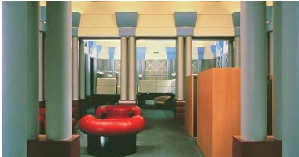
طراحی داخلی پست مدرن اثر معمار بزرگ پست مدرن مایکل گریوز

مبلمان پست مدرن از روحیه فردگرایانه‌تری برخوردار است و از ایده‌پردازی از فرهنگ عامه استقبال می‌کند. فضای داخلی پست مدرن جادار است؛ با پنجره‌های بزرگ و سقف‌های بلند.