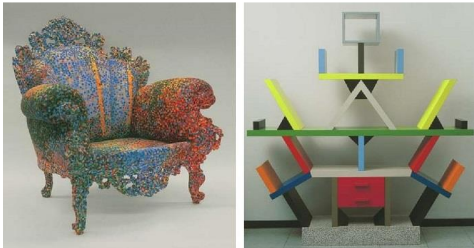
طراحی مبلمان آوانگارد - مبلمان سمت چپ از کارهای گروه معروف آوانگارد Studio Alchimia است.

هر هنری که مرزهای خلاقیت را جابجا کند و بینش و ایده‌پردازی هنرمند را مهم بداند، یک هنر آوانگارد است. هنر آوانگارد رادیکال و چالش‌برانگیز است و هنرمندان آوانگارد به دنبال تاثیرگذاری بر ذهن مخاطبان از طریق هنر خود هستند.