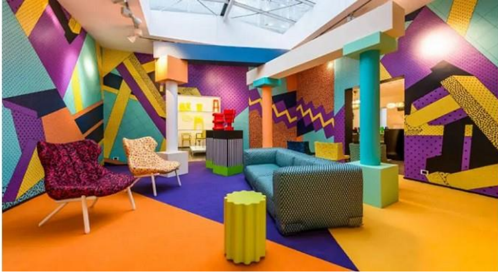
طراحی داخلی پست مدرن - کاری از گروه ممفیس

طراح ایتالیایی Ettore Sottsass یکی از طراحان مطرح مبلمان پست مدرن بود که گروه ممفیس را در واکنش به خطوط مستقیم و کارکردگرایی سبک مدرن تأسیس کرد. سبک ممفیس رنگارنگ و انتزاعی با اشکال غیرمعمول و عدم تقارن است.