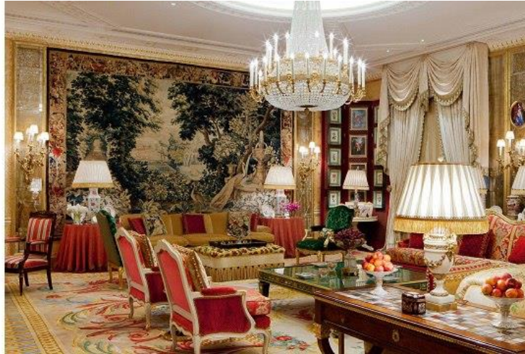
طراحی داخلی به سبک ایرانی