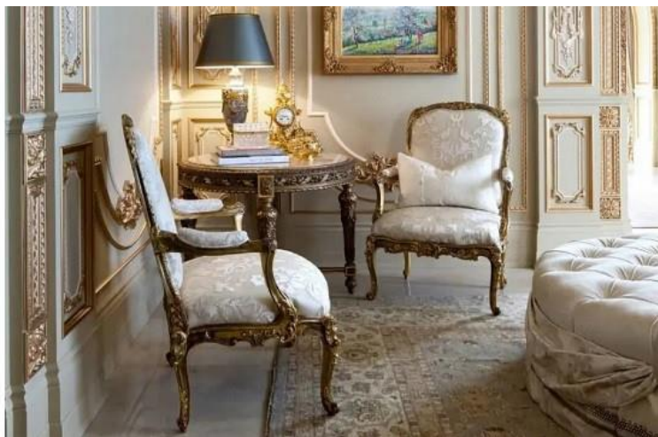
طراحی دکوراسیون داخلی به سبک سنتی فرانسوی