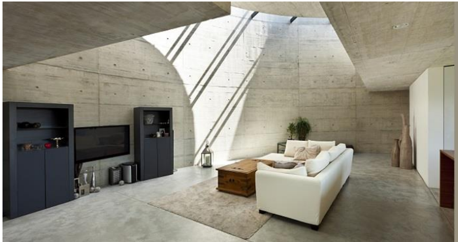
معماری داخلی آوانگارد - نوآور در انتخاب فرم و مصالح برای فضای نشیمن

هر هنری که مرزهای خلاقیت را جابجا کند و بینش و ایده‌پردازی هنرمند را مهم بداند، یک هنر آوانگارد است. هنر آوانگارد رادیکال و چالش‌برانگیز است و هنرمندان آوانگارد به دنبال تاثیرگذاری بر ذهن مخاطبان از طریق هنر خود هستند.