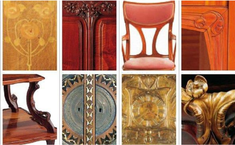
مجموعه ای از جزئیات تزئینی سبک آرت نوو

هندسه تزئینات در سبک آرت نوو از خطوط نامتقارن طبیعی و تزئینات خلاقانه روکوکو و هنر ژاپنی ایده می‌گیرد. سبک آرت نوو یکی از چشمگیرترین سبک‌ها در طراحی جداره‌های داخلی ساختمان، راه‌پله‌ها و مبلمان داخلی است.