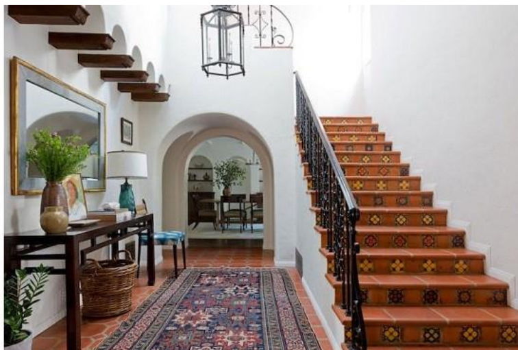
سبک اسپینیش در معماری داخلی منزل