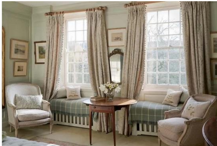
طراحی داخلی به سبک بیلاقی انگلیسی