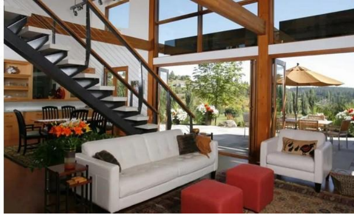
معماری داخلی به سبک شمال غربی آمریکا