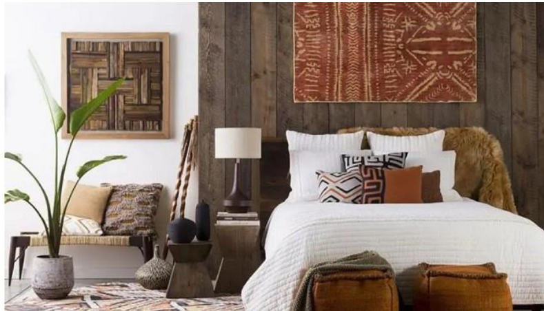
معماری داخلی به سبک آفریقایی