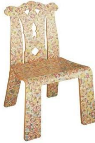
طراحی مبلمان پست مدرن و طراحی داخلی خانه مادر - اثر رابرت ونچوری معمار برجسته پست مدرن

مبلمان پست مدرن از روحیه فردگرایانه‌تری برخوردار است و از ایده‌پردازی از فرهنگ عامه استقبال می‌کند. فضای داخلی پست مدرن جادار است؛ با پنجره‌های بزرگ و سقف‌های بلند.