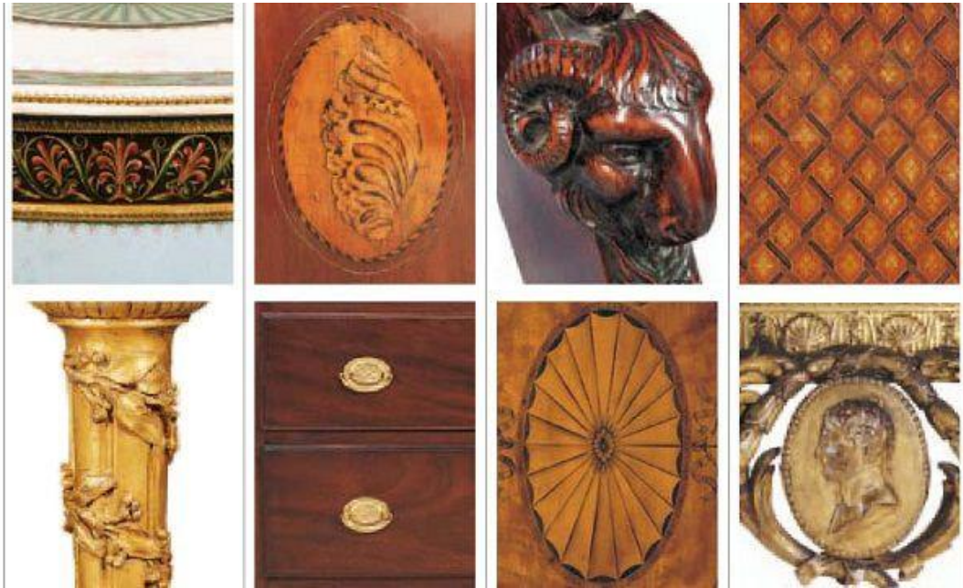
تعدادی از جزئیات تزئینی سبک نئوکلاسیک

سبک نئوکلاسیک نیز در نیمه دوم قرن ۱۸ در پاسخ به تجمل‌گرایی روکوکو شکل گرفت. هندسه کلی فضا در سبک نئوکلاسیک ساده و مستطیلی است و در تزئینات این سبک از موتیف‌های معماری کلاسیک مانند گچ‌بری با طرح Meander و Vitruvian scroll استفاده می‌شود.