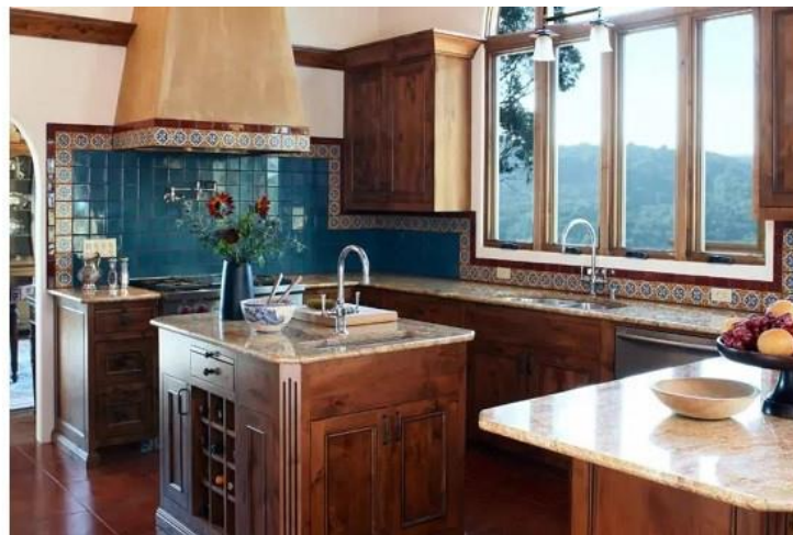
طراحی داخلی به سبک مکزیکی